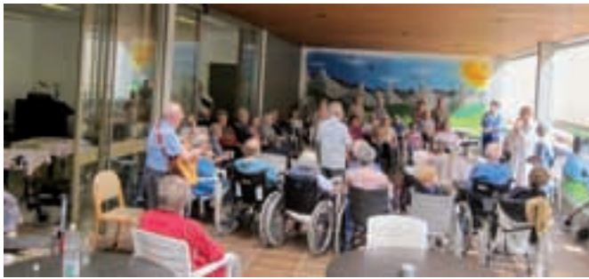
Un altro momento della Santa Messa al San Carlo