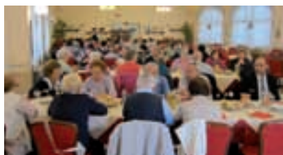
Pellegrinaggio di Zona: Il momento del pranzo