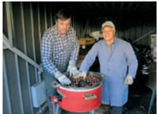
Al termine dell'Ottavario di preghiera per i Defunti: i nostri marronai all'opera