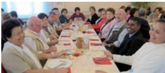
Pellegrinaggio di Zona: una tavolata con alcuni dei "nostri"