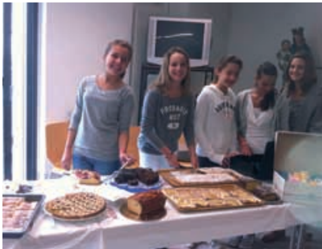
Festa dell'Amicizia: al servizio della Comunità