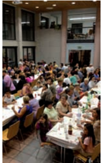
Festa del Quartiere 2013