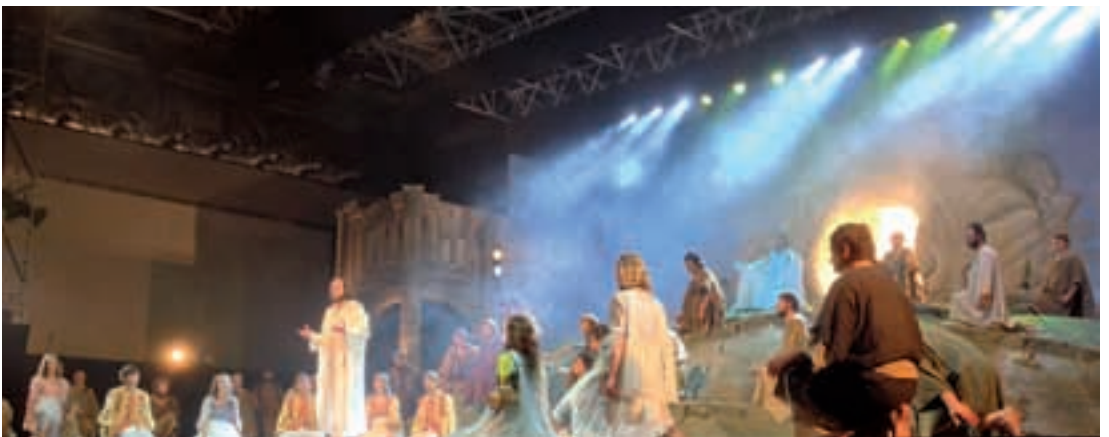
Recital "Credo": il momento finale, la Risurrezione di Gesù