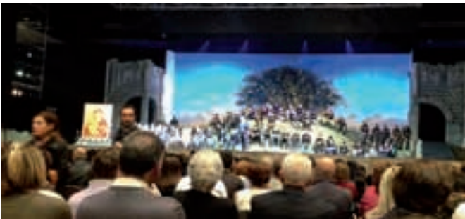
Recital "Credo" della Comunità Cenacolo a Milano: la sala gremita durante le testimonianze