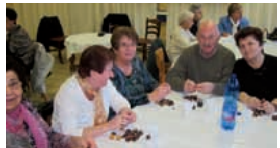
Castagnata: alcuni partecipanti