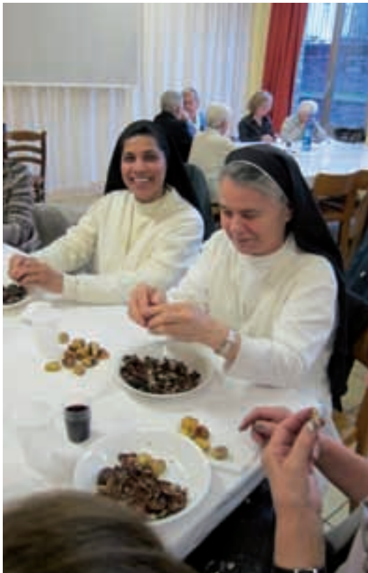
Castagnata: la presenza delle Suore