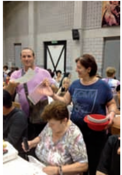
Festa del Quartiere: tombola