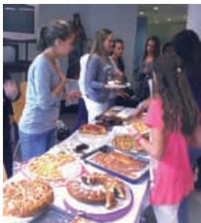
Festa dell'Amicizia: alcune nostre ragazze "in azione" al banco del dolce