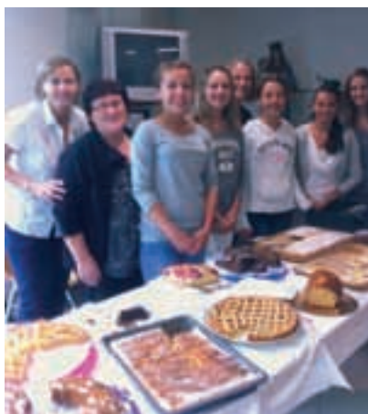
Festa dell'Amicizia: "dietro le quinte" i più esperti "vegliano"