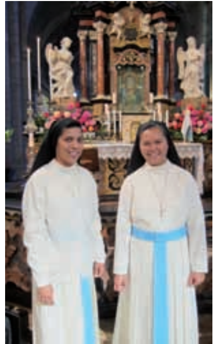
Pellegrinaggio di Zona: le nostre Suore davanti all'Immagine della Vergine