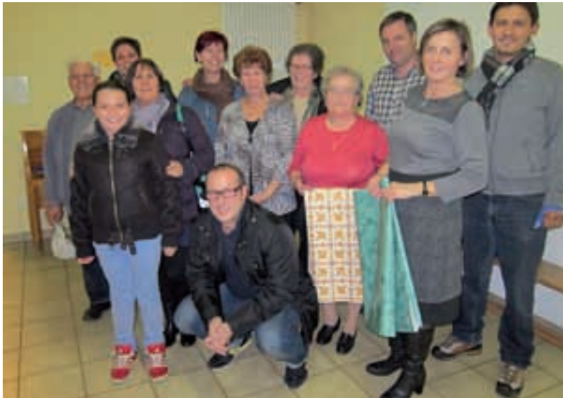
Castagnata: Il "team dei collaboratori"