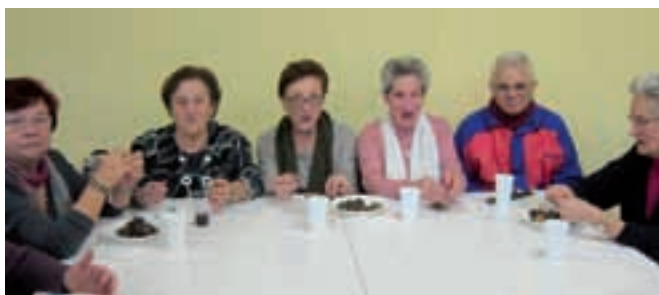
Castagnata: alcuni partecipanti