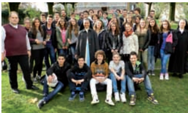
Giornata di ritiro dei Cresimandi: la foto di Gruppo