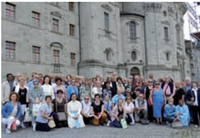
Pellegrinaggio vicariale a Einsiedeln