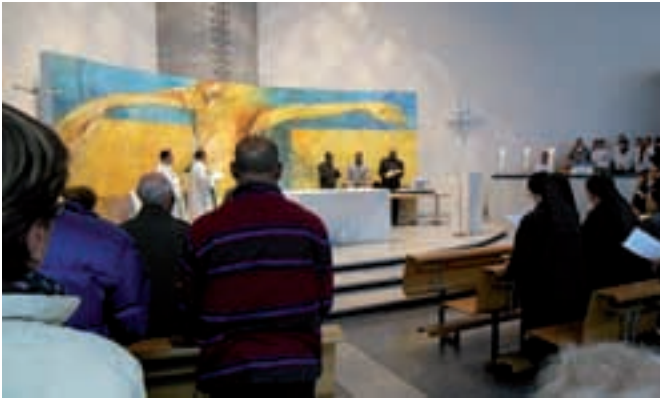
Un momento dell'incontro missionario vicariale alla Sacra Famiglia